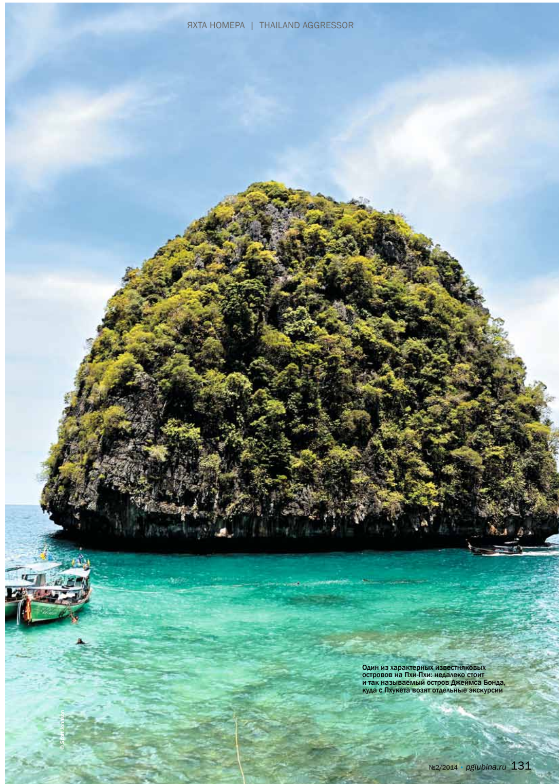
Один из характерных известняковых островов на Пхи-Пхи: недалеко стоит и так называемый остров Джеймса Бонда, куда с Пхукета возят отдельные экскурсии