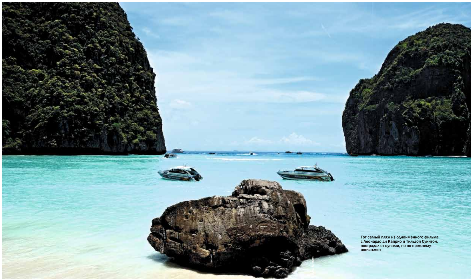
Тот самый пляж из одноимённого фильма с Леонардо ди Каприо и Тильдой Суинтон: пострадал от цунами, но по-прежнему впечатляет

С мая по октябрь здесь дует юго-западный муссон, и под его воздействием на островах сформированы два непохожих ландшафта: рифы со свалами на восточной стороне и скалистые пейзажи на западной.